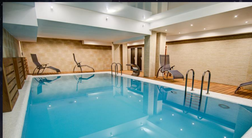
Аква-зона с сауной и хамамом